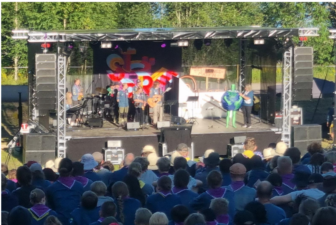
Lägerbål på Större.